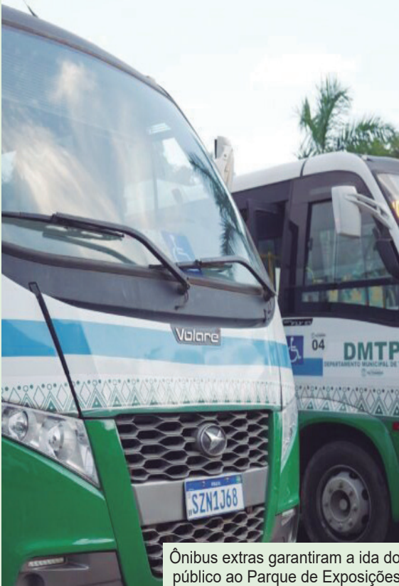
Ônibus extras garantiram a ida do público ao Parque de Exposições