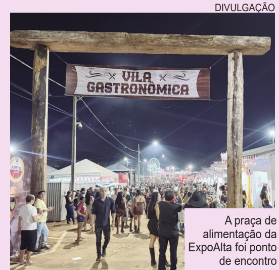
A praça de alimentação da ExpoAlta foi ponto de encontro