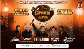
Show do cantor Leonardo abriu a primeira noite da ExpoAlta