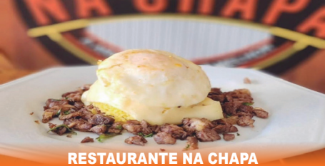
RESTAURANTE NA CHAPA

Para quem busca uma refeição saborosa e caseira, o Restaurante Na Chapa é uma excelente opção em Altamira. Localizado na Travessa Pedro Gomes, nº 1350, no bairro Sudam I, o espaço serve café da manhã e almoço todos os dias, com exceção dos sábados. No cardápio da manhã, há delícias como tapiocas, pães e cuscuz; e, no almoço, pratos preparados na hora, com frango, carne e linguiça. O atendimento vai das 7h às 14h, em um ambiente simples e acolhedor. Para mais informações, o contato é (93) 99137-6170.