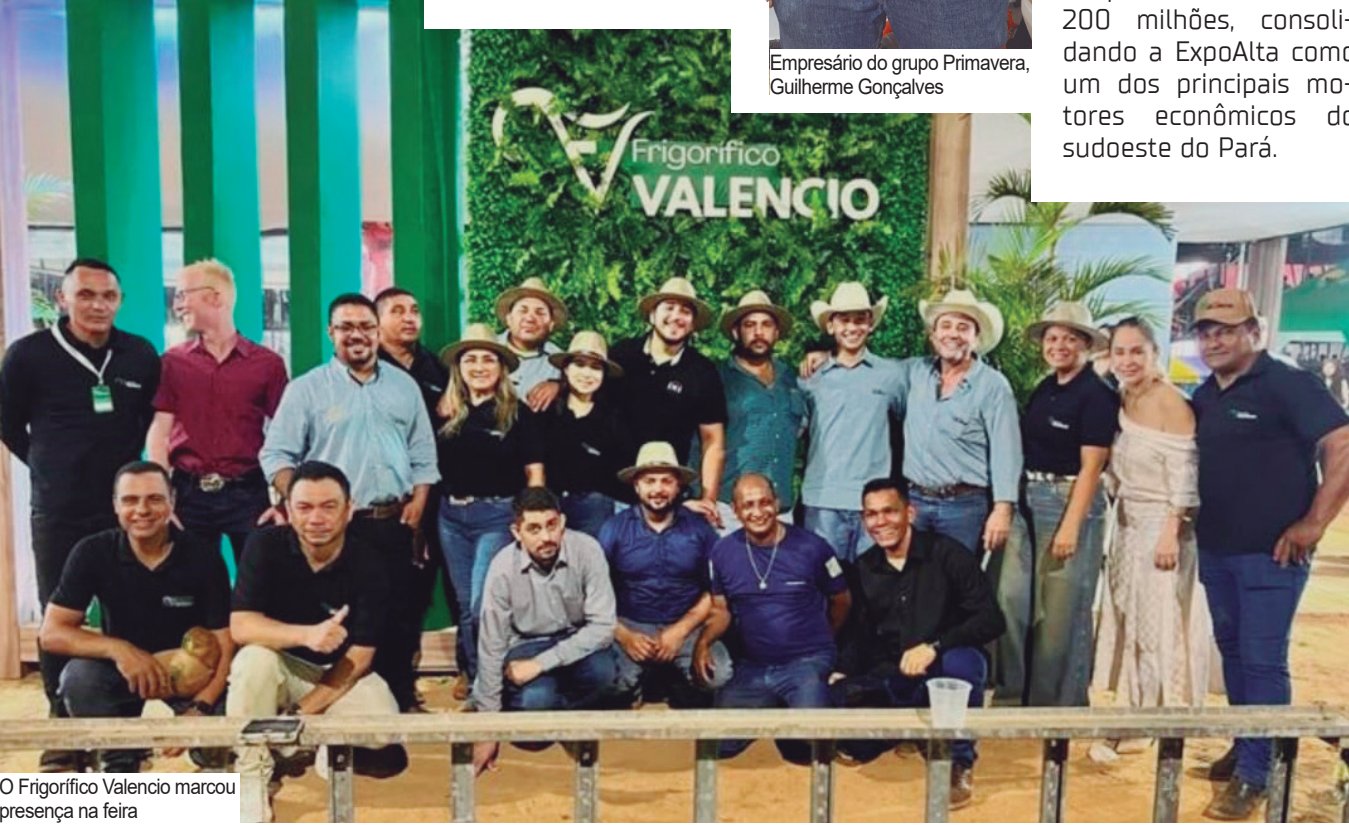
O Frigorífico Valencio marcou presença na feira