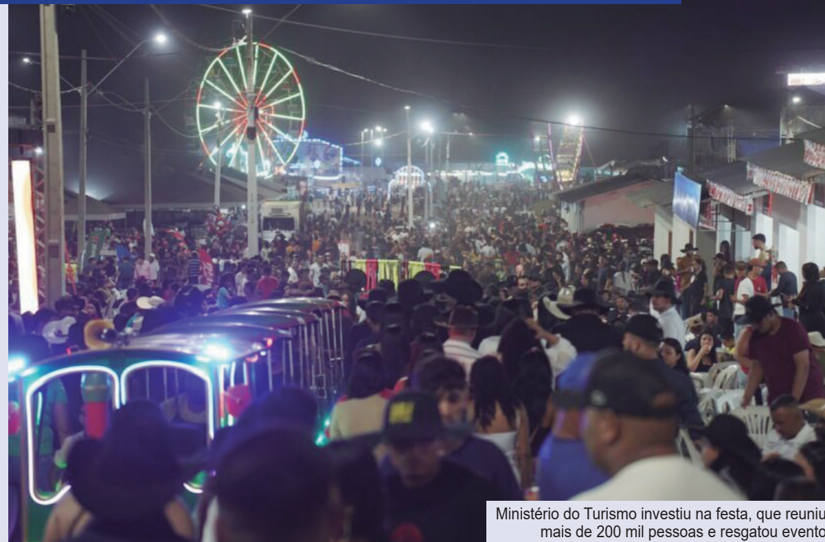
Ministério do Turismo investiu na festa, que reuniu mais de 200 mil pessoas e resgatou evento