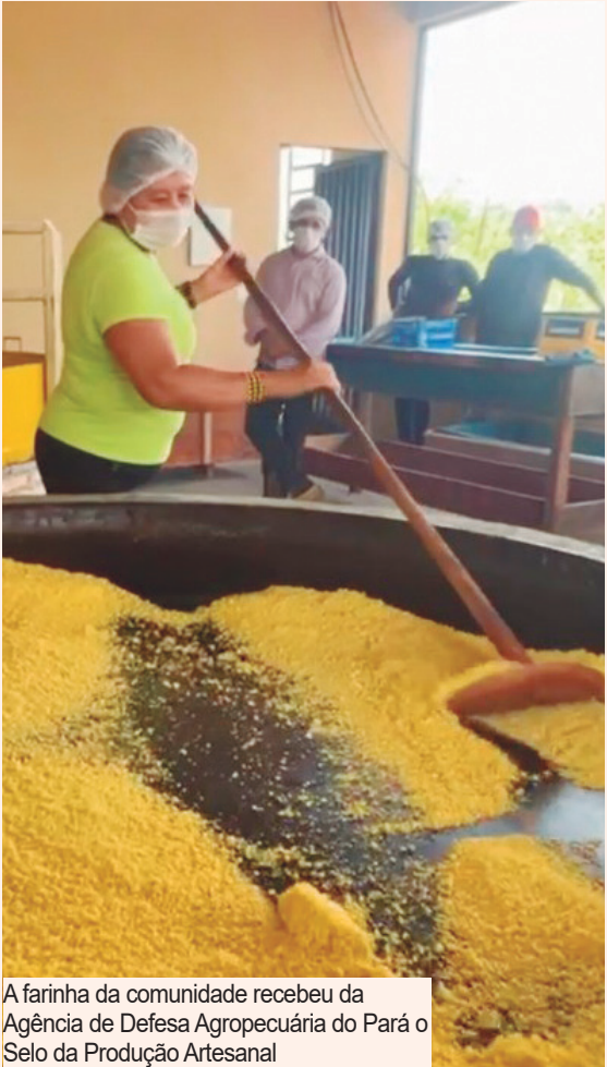
A farinha da comunidade recebeu da Agência de Defesa Agropecuária do Pará o Selo da Produção Artesanal

da nossa comunidade. A nossa marca "Sasa tiha" é um orgulho, ao ver funcionando e gerando resultados para todos que fazem parte dessa caminhada junto com a Norte Energia", contou. A agroindústria foi implantada com apoio da Norte Energia, dentro de ações do Plano Básico Ambiental do Componente Indígena. O projeto envolveu capacitação, acompanhamento técnico, regularização sanitária, licenciamento ambiental e emissão do Cadastro Nacional da Agricultura Familiar para os produtores.