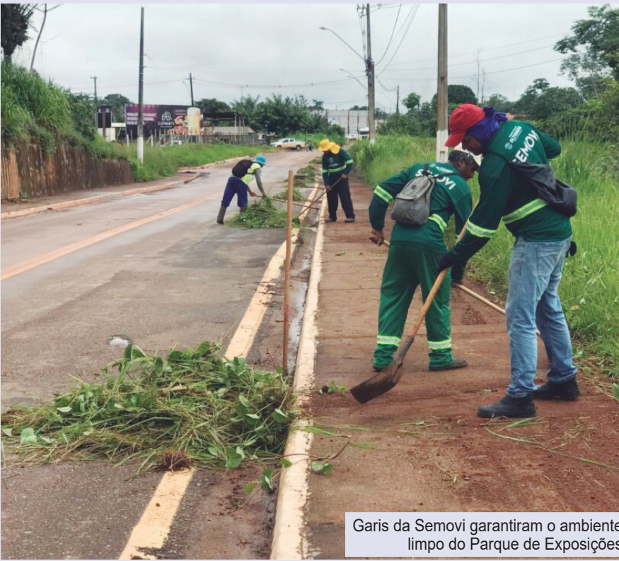
Garis da Semovi garantiram o ambiente limpo do Parque de Exposições

A ExpoAlta, que retornou neste ano após cinco temporadas sem edição, é considerada o maior evento do agronegócio da região do Xingu. Ao longo dos cinco dias de programação, o Parque de Exposições reuniu mais de 100 mil visitantes, mais de 200 expositores e movimentou cerca de R$ 120 milhões em negócios.