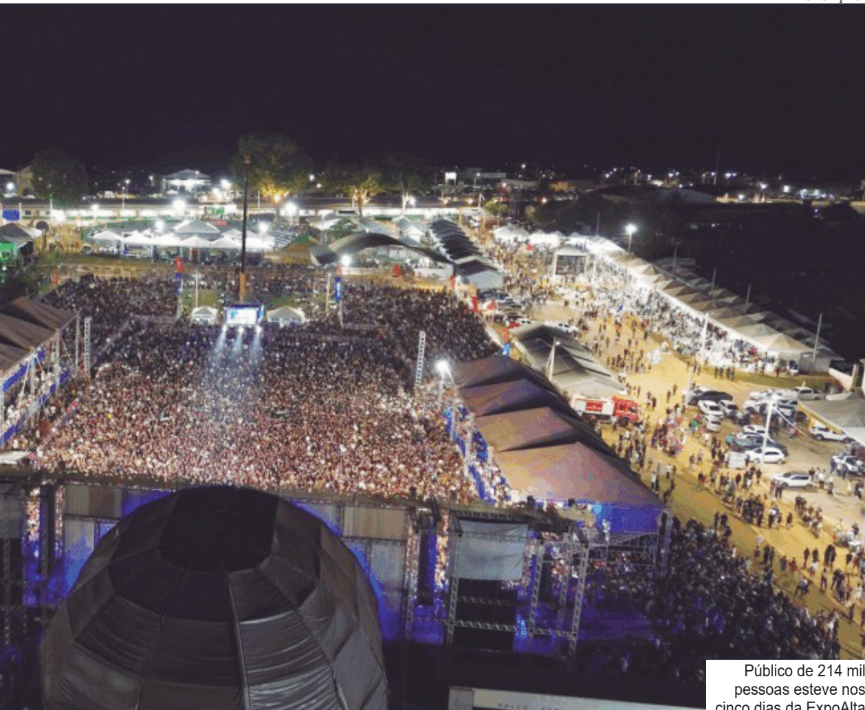
Público de 214 mil pessoas esteve nos cinco dias da ExpoAlta