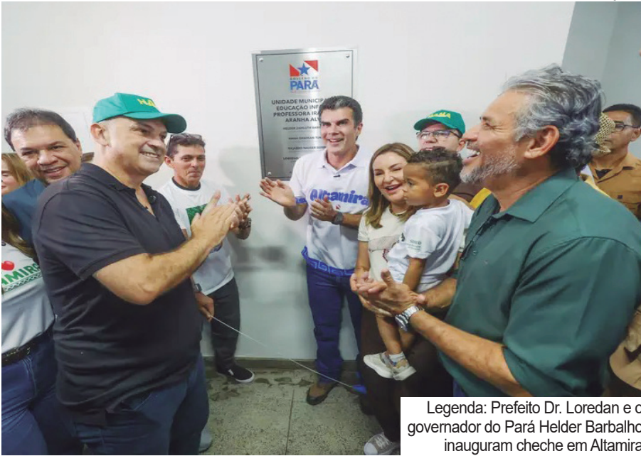
Legenda: Prefeito Dr. Loredan e o governador do Pará Helder Barbalho inauguram cheche em Altamira

O governador do Pará, Helder Barbalho, esteve em Altamira, na semana passada, para cumprir agenda. Ele anunciou investimentos importantes na educação e na saúde do município. A visita incluiu a inauguração de uma creche pelo programa Creches por Todo o Pará, a assinatura da ordem de serviço para ampliação do Hospital Regional Público da Transamazônica e a participação na 42ª Expoalta. A nova unidade do programa Creches por Todo o Pará recebeu investimento de R$ 4 milhões e tem capacidade para atender até 200 crianças de até 5 anos. O espaço